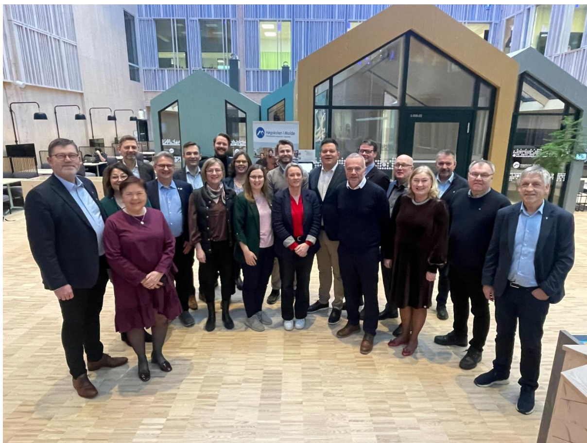
Bilde fra felles IPR-samling i Møre og Romsdal, i Kristiansund, 6.-7. februar 2025.